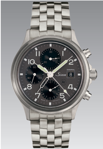
358 DIAPAL: Massives Feingliederarmband aus satiniertem Edelstahl. ø 42 mm (Abb.: 1:1)