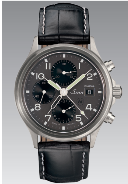
358 DIAPAL: Schwarzes Lederarmband mit Alligatorprägung und Kontrastnaht. ø 42 mm (Abb.: 1:1)