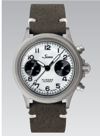
356 FLIEGER Klassik W: graues Nubuk-Wildschweinlederarmband. Garantie 2 Jahre. ø 38,5 mm (Abb.: 1:1)