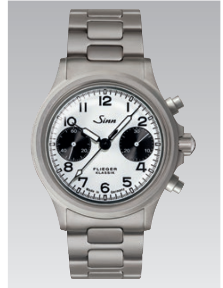
356 FLIEGER Klassik W: massives Edelstahlarmband. Garantie 2 Jahre. ø 38,5 mm (Abb.: 1:1)