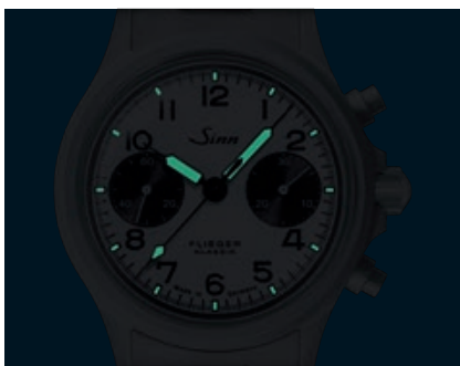
356 FLIEGER Klassik W – Nachleuchtschema. (Abb.: 1:1)