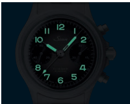
356 FLIEGER Klassik AS E – Nachleuchtschema. (Abb.: 1:1)