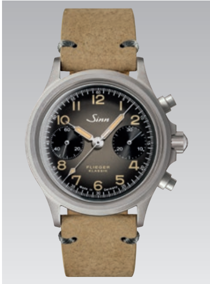
356 FLIEGER Classique AS E : bracelet en cuir nubuk de sanglier sable. Garantie à 2 ans. ø 38,5 mm (ill : 1:1)