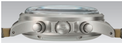
Vues de dos et de côté. (ill : 1:1)