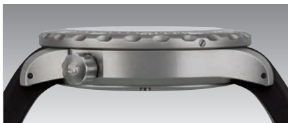
U50 DS: Rückansicht und Seitenansicht. (Abb.: 1:1)