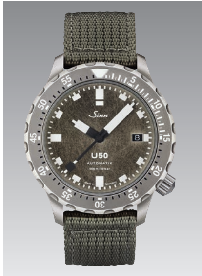
U50 DS: olivgraues Textilarmband. Garantie 2 Jahre. ø 41 mm (Abb.: 1:1)