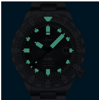
U50 DS - Nachleuchtschema. (Abb.: 1:1)

Große Abbildung auf der Vorderseite: U50 DS: Edstahlarmband mit Sicherheitsfallschleife und ausklappbarer Bandverlängerung. Garantie 2 Jahre.