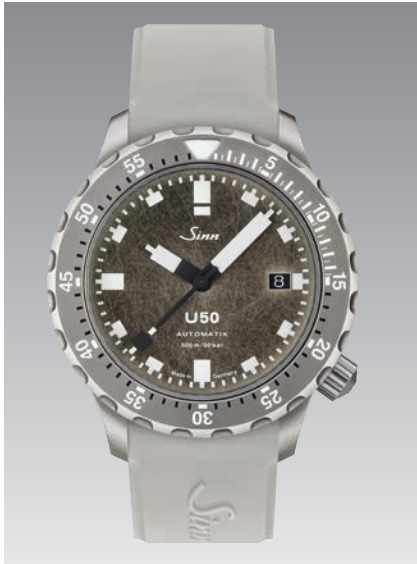
U50 DS: graues Silikonarmband mit großer Fallschleife oder Schmetterlingsfallschleife. Garantie 2 Jahre. ø 41 mm (Abb.: 1:1)