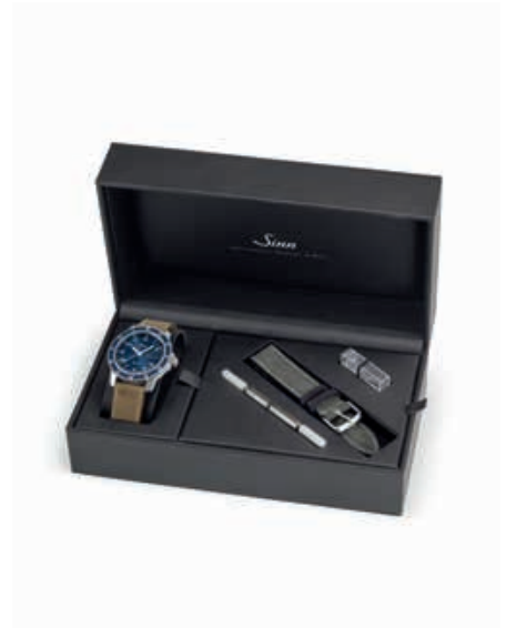
Die Uhr erhalten Sie in einem edlen Etui mit einem grauen und einem sandfarbenen Canvas-Lederarmband, Bandwechselwerkzeug, Ersatzfederstegen und Broschüre.