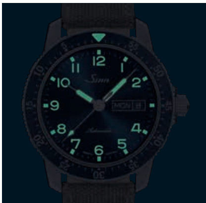
104 St Sa A B E – Nachleuchtschema. (Abb.: 1:1)

Ausgeliefert wird die 104 St Sa A B E im Set mit zwei Canvas-Lederarmbändern.