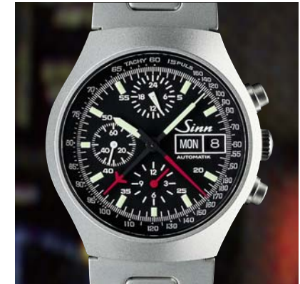
Modell 157 St Ty