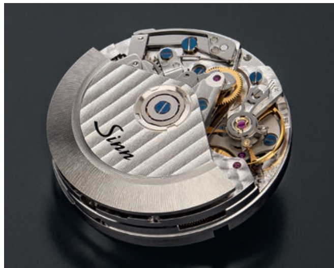
SINN-Kaliber SZ01. SINN-Caliber SZ01.