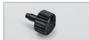
Auch für den Bügel der Schließe und die Krone verwenden wir Damaszener Stahl auf Basis hochwertiger Edelstähle.