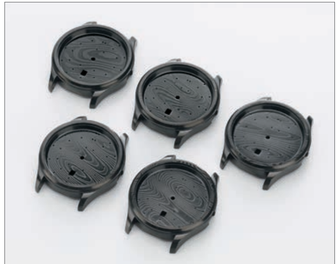
Surface etching is used to reveal the layered structure. Each watch is a unique timepiece, as the flow of lines cannot be physically manipulated.

We are therefore proud to present to you another perfectly executed Damaszener watch.