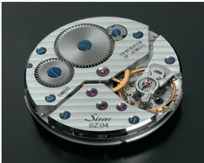
Unser Handaufzugskaliber SZ04 mit Régulateuranzeige. Our hand-wound calibre SZ04 with regulateur.

Die SZ-Kaliber 02, 03, 05 und 06 sind aus der Entwicklung des SZ01 abgeleitete Werkmodifikationen, die durch einen dezentralen 60-Minuten-Stoppzähler gekennzeichnet sind. Die 60er-Teilung des Stoppminutenzählers erleichtert im Vergleich zur sonst üblichen 30er-Teilung das schnelle, intuitive Ablesen der Stoppzeit.