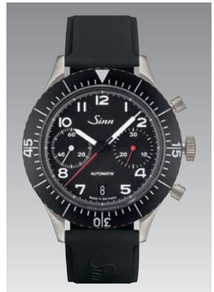
158 : bracelet en silicone noir et boucle ardillon. ø 43 mm (ill. : 1:1)