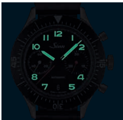
158 - Éléments luminescents. (ill. : 1:1)