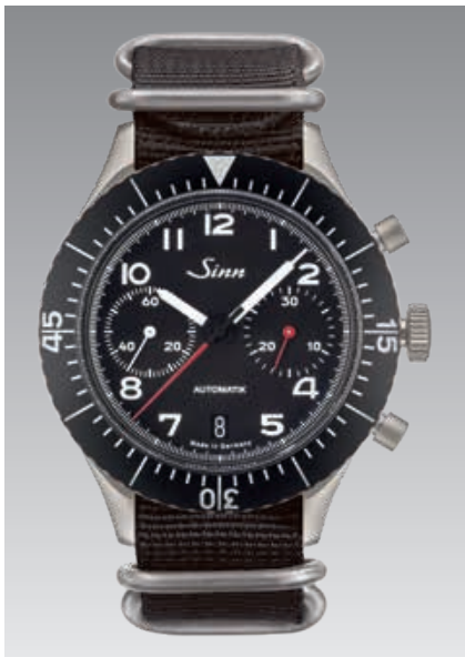
158 : bracelet en textile noir. ø 43 mm (ill. : 1:1)