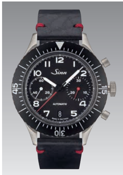
158 : bracelet en cuir vachette noir façon vintage. ø 43 mm (ill. : 1:1)