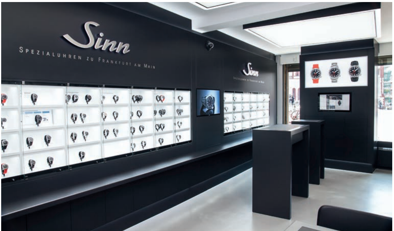
Blick in den Verkaufsbereich unserer Niederlassung in der Innenstadt von Frankfurt am Main. Römerberg 34 lautet die Adresse. Es ist das geschichtsträchtige „Haus zum Goldenen Rad“ direkt gegenüber dem Frankfurter Römer, seit dem 15. Jahrhundert das Rathaus unserer Stadt.