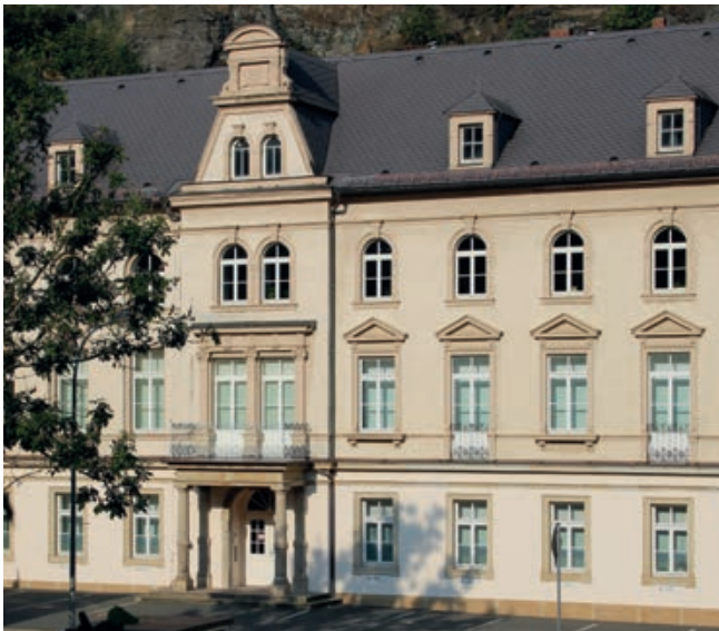
Das Gebäude der Sächsische Uhrentechnologie GmbH Glashütte (SUG) liegt an der „Glashütter Uhrenmeile“ in unmittelbarer Nachbarschaft der namhaftesten Glashütter Uhrenmanufakturen. Die historische, denkmalgeschützte Fassade (Abbildung) zierte einst das 1889 erbaute Hotel Kaiserhof „Stadt Dresden“.