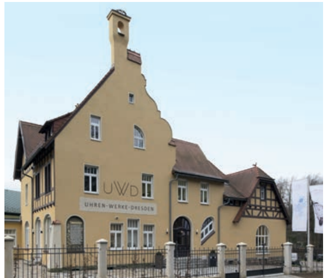
Historische Architektur verschmilzt mit hochmoderner Technik. Die Produktions- und Geschäftsräume der Uhren-Werke-Dresden (UWD) befinden sich in der Ullersdorfer Mühle – ein ganz besonderer Ort direkt am Rande der Dresdner Heide.