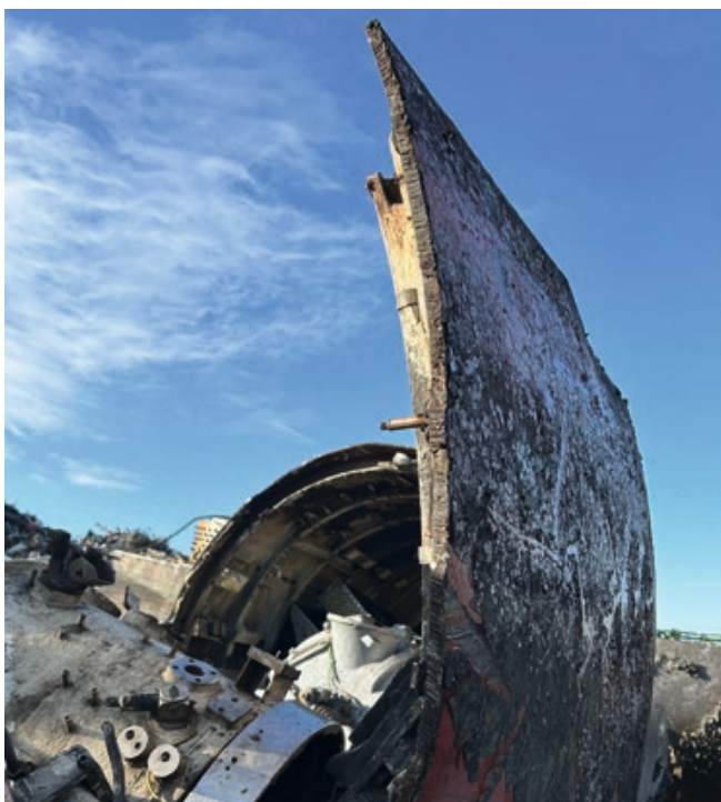
Die Wandstärke eines U-Bootes der Klasse 206 ist im Inneren dank ausgeklügelter Versteifungsstruktur viel dünner, als man denkt.