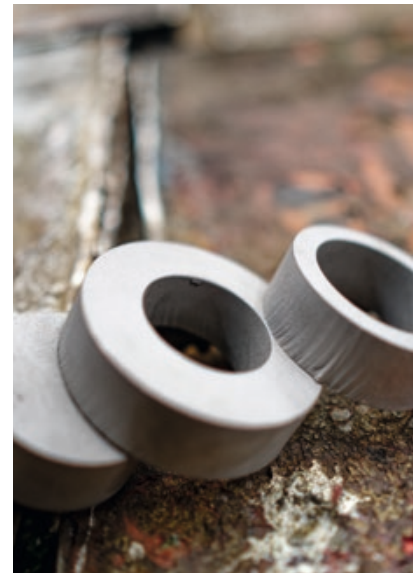
Das mit einem Radius versehene Plattenmaterial des U-Boot-Rumpfes stellte ungewöhnliche Anforderungen an den Fertigungsprozess für die rotationssymmetrischen Gehäuse-Rohlinge.