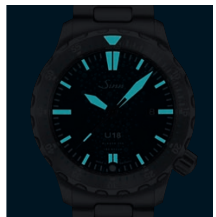
U18: Nachleuchtschema. (Abb.: 1:1)