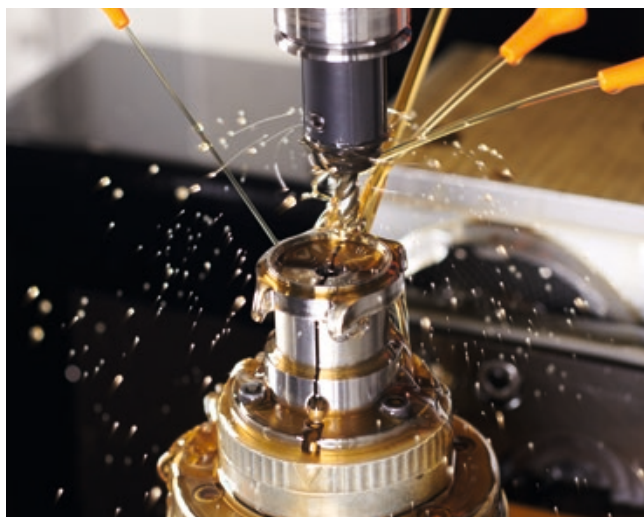
Ein fast fertiges Gehäusemittelteil auf einem Bearbeitungsautomaten der SUG.