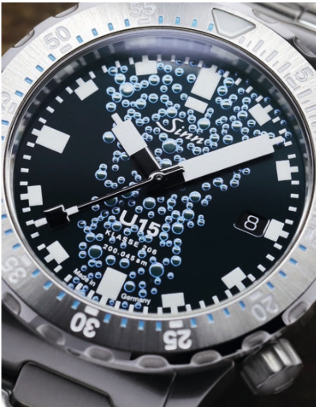
Stilisierte Luftblasen auf dem hochglänzenden Zifferblatt erzeugen einen einzigartigen Effekt.