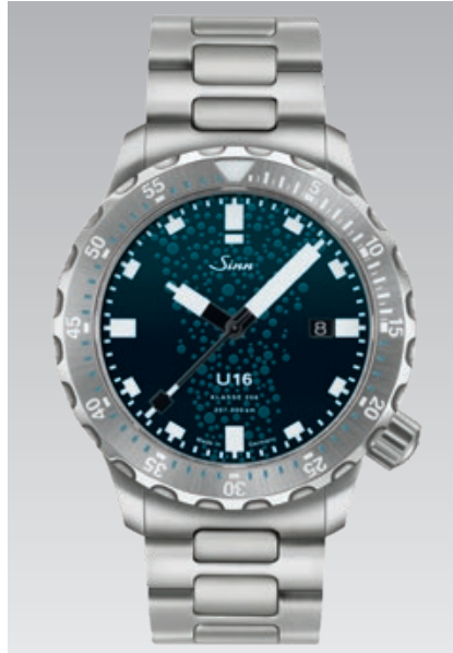
U16: massives Edelstahlarmband mit Bandlängen-Feinverstellung. Garantie 2 Jahre. ø 44 mm (Abb.: 1:1)