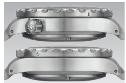
U18: Rückansicht und Seitenansichten. (Abb.: 1:1)