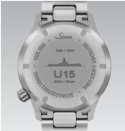
U15: Rückansicht und Seitenansichten. (Abb.: 1:1)