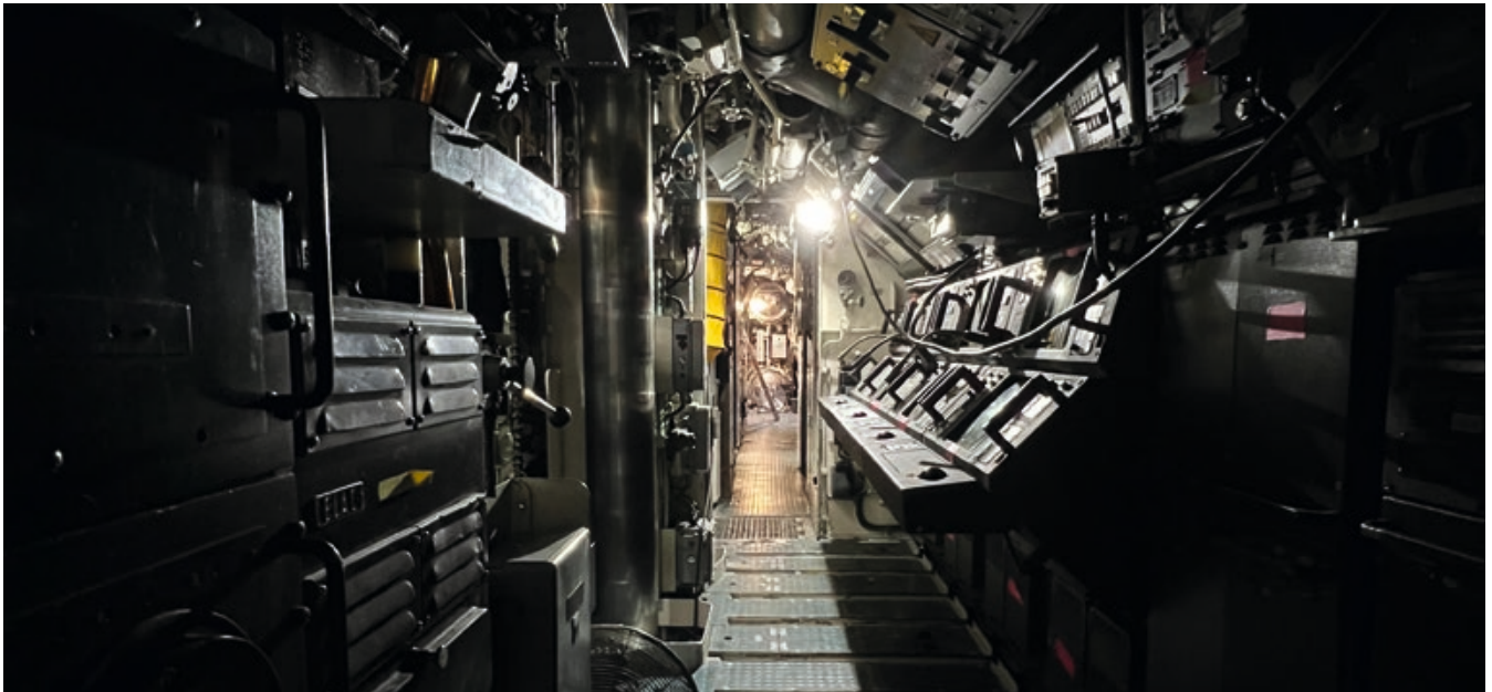
Blick durch die Operationszentrale des Bootes in Richtung Bug zu den Torpedorohren.