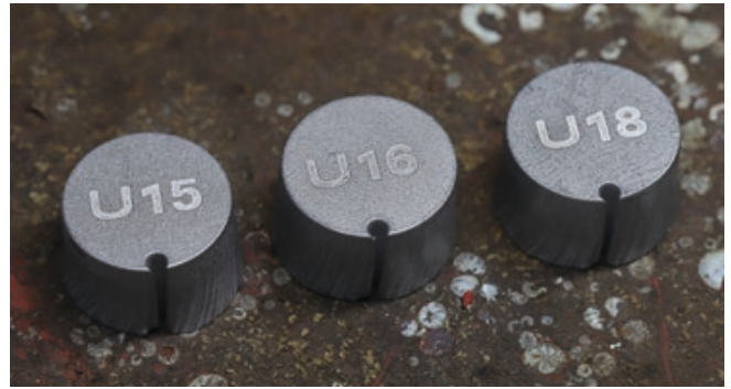
Gravierte Rondens aus dem Original-Stahl des jeweiligen U-Bootes, die jeder der auf 1.000 Stück limitierten Uhren beigelegt sind.

Kurz: Dieser Stahl atmet durchlebte U-Boot-Historie. Die professionelle und äußerst aufwendige Aufbereitung durch die Sächsische Uhrentechnologie GmbH Glashütte (SUG) macht ihn schließlich zu einem Material, das unseren hohen Ansprüchen an den Uhrenbau genügt – ohne dass er seine wahre Identität verliert. Das Ergebnis? Drei Taucheruhren, die mit allen Wassern gewaschen sind, im wahrsten Sinne des Wortes. Sie bringen die Seele maritimer Vergangenheit ans Handgelenk. Für diejenigen, die den Wert einer solchen Tradition zu schätzen wissen und sie mit Stolz tragen möchten. Sinnlich erfahren lässt sich dies auf einer weiteren Ebene durch eine gravierte Ronde aus Original-Stahl vom jeweiligen U-Boot, die jeder Uhr beigelegt ist.