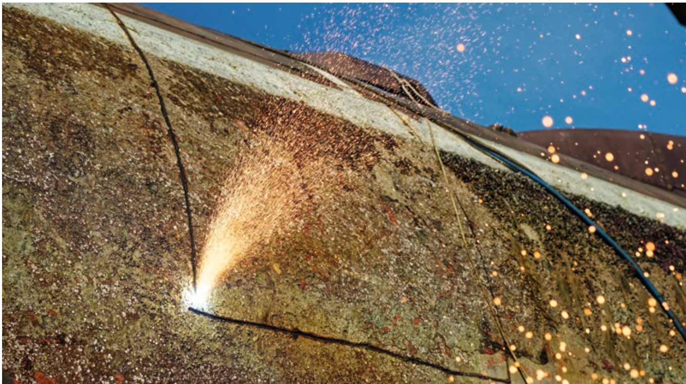
Der erste Schritt der Verwertung bei der KSH: Stahlplatten werden per Schneidbrenner aus dem Rumpf des U-Bootes U 15 herausgetrennt.

Als die U-Boote schließlich im Kieler Ostuferhafen anlandeten, spürte jeder der Anwesenden die Besonderheit dieses Moments. Er war geprägt von tiefer Bewunderung und Respekt für die enormen Leistungen im Dienste der Verteidigung der Bundesrepublik. Aus dem Stahl dieser geschichtsträchtigen Unterseeboote drei exklusive Zeitmesser zu fertigen, bedeutet weit mehr als die Kunst des Uhrenbaus zu ehren. Es ist ein Tribut an die Zeit selbst, eine noch nie dagewesene Gelegenheit, maritime Historie am Handgelenk zu tragen. Mit jedem nahezu lautlosen Ticken der Uhren lebt die Faszination der Unterwasserwelt und die Legende dieser Boote weiter.