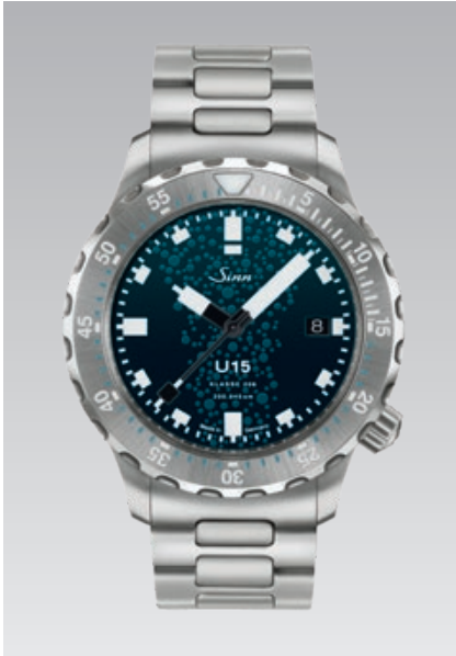
U15: massives Edelstahlarmband mit Bandlängen-Feinverstellung. Garantie 2 Jahre. ø 41 mm (Abb.: 1:1)