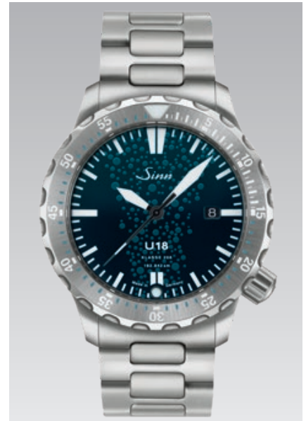
U18: massives Edelstahlarmband mit Bandlängen-Feinverstellung. Garantie 3 Jahre. ø 44 mm (Abb.: 1:1)

Sie erhalten die Uhren in einem nachhaltigen Doppelpaket mit einem massiven Edelstahlarmband mit Bandlängen-Feinverstellung, einem Leinensäckchen mit gravierter Runde, passend zu der gelieferten Uhr, einem Bandwechselwerkzeug, Edelstahlfederstegen und einer Broschüre.