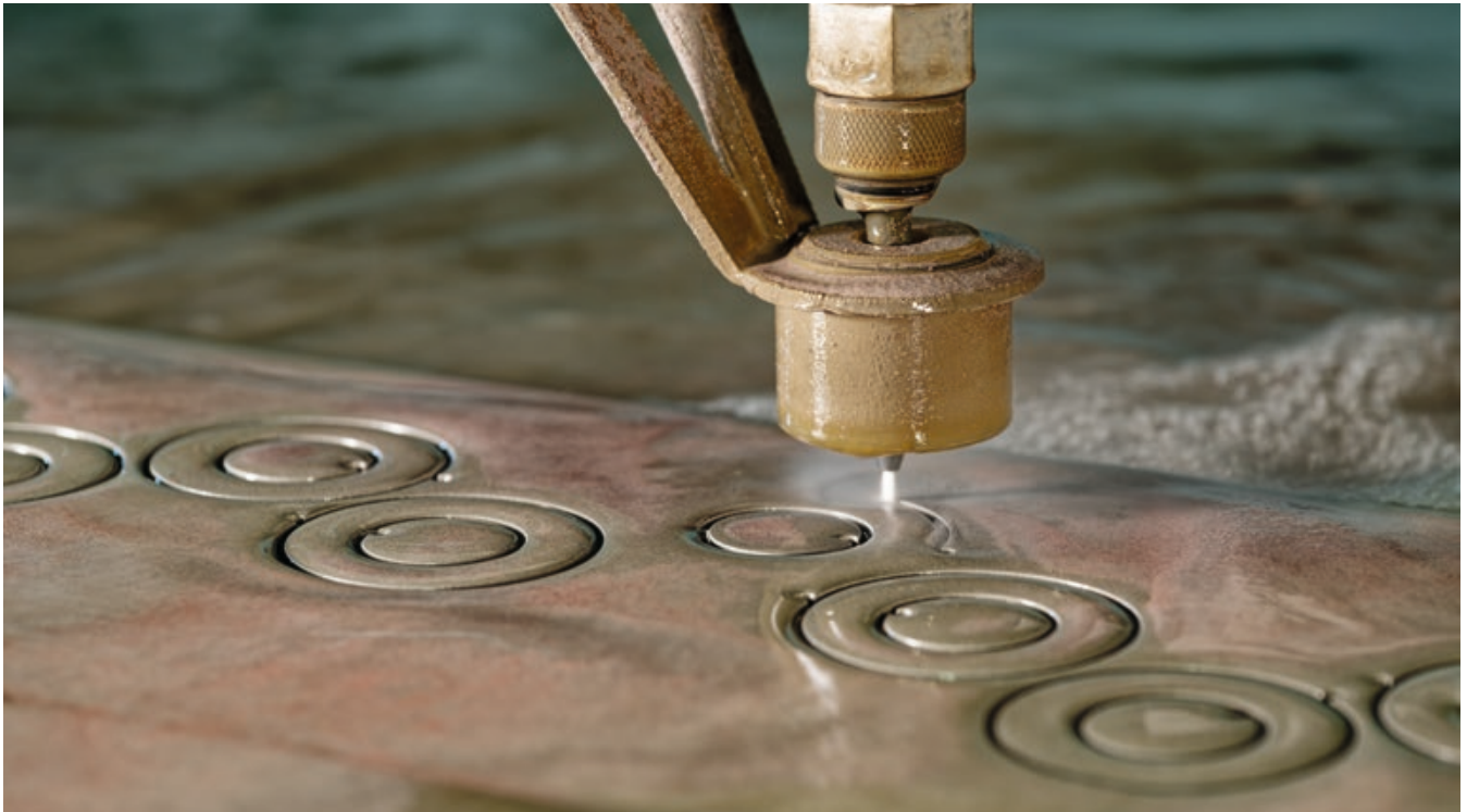
Per Wasserstrahl werden die Rohlinge für Boden, Gehäusemittelteil und Drehring aus den gerichteten Platten des deutschen U-Boot-Stahls herausgeschnitten.