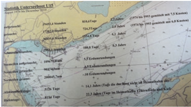
Statistik über zurückgelegte Seemeilen des U-Bootes U 15, erstellt von einem ehemaligen Besatzungsmitglied. Sie entsprechen 10 Erdumrundungen in 36 Jahren.