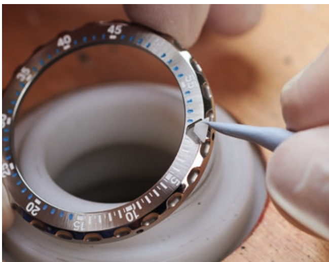
Das Leuchtdreieck des Drehrings wird von Hand eingesetzt und verklebt.