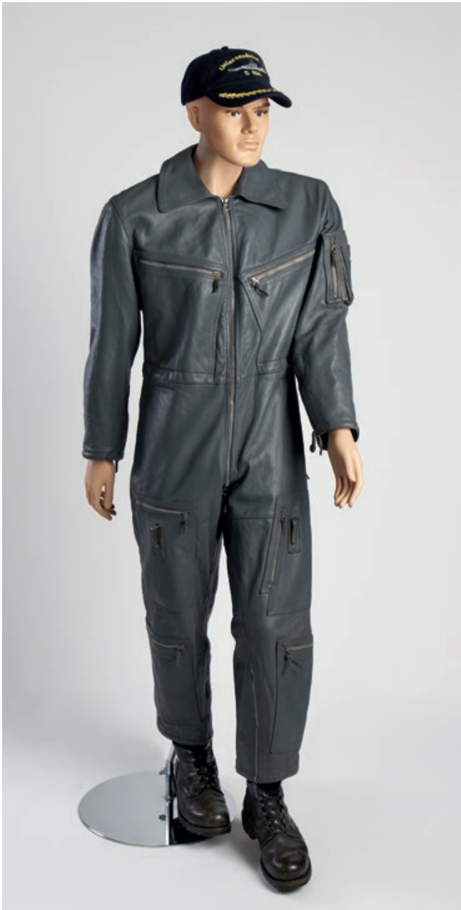
Diese Leder-Kombi wurde vom Brückenpersonal nur zu besonderen Anlässen getragen.