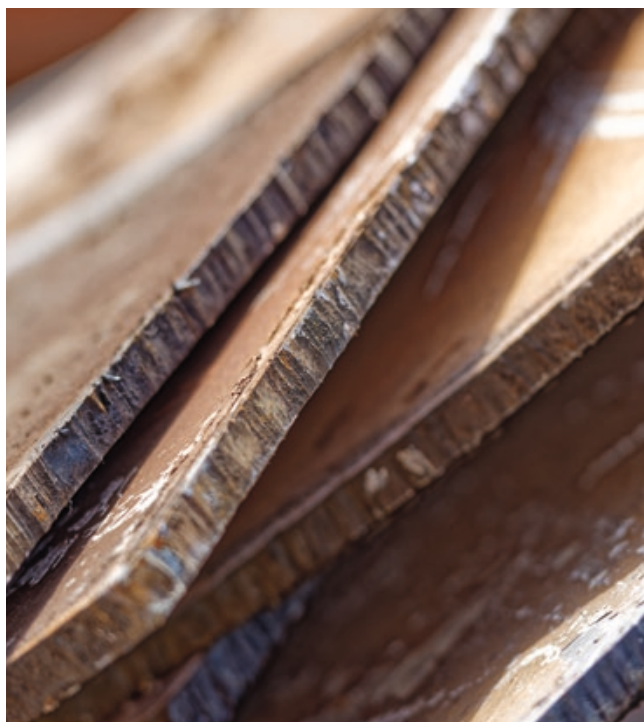
Herausgetrennte Platten des amagnetischen deutschen U-Boot-Stahls, die zur weiteren Verarbeitung erst noch gerichtet werden müssen.