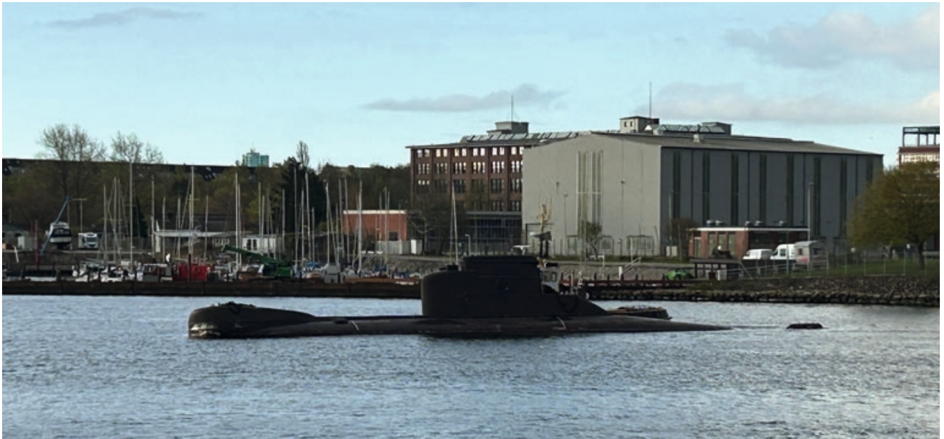
Das U-Boot U 15 am Tag seiner letzten Fahrt auf dem Weg vom Marinehafen Kiel zum Kieler Osthafen, dem Sitz der KSH.

Diese Unterseeboote sind weit mehr als stählerne Kolosse. Sie sind wahre Legenden, geformt von den Herausforderungen eines nahezu 40 Jahre dauernden Einsatzes für Deutschland, länger als jede andere U-Boot-Klasse. Ihre Mission? Die Ostsee und ihre Zugänge zu schützen. Jedes Boot durchpflügte dabei die See in Hunderttausenden Seemeilen über und unter Wasser. Mit der Außerdienststellung liefern sie nun das Herzstück für diese drei einzigartigen Taucheruhren: den Stahl für die Gehäuse. Gleichzeitig sind sie Namensgeber, sortenrein aufbereitete Materialquellen und erinnerungsträchtige Brücke zu einer unvergessenen deutschen U-Boot-Ära. Schließlich werden die Uhrenmodelle jeweils aus dem Stahl der gleichnamigen Unterseeboote gefertigt.