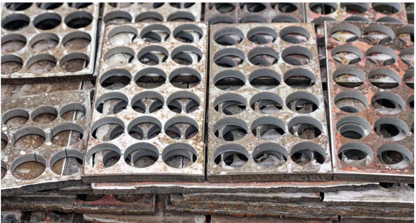
Bestmögliche Ausnutzung des Materials dank CAD-gesteuerter Wasserstrahlschneidanlage. Auch die Überreste werden weiterverwertet.