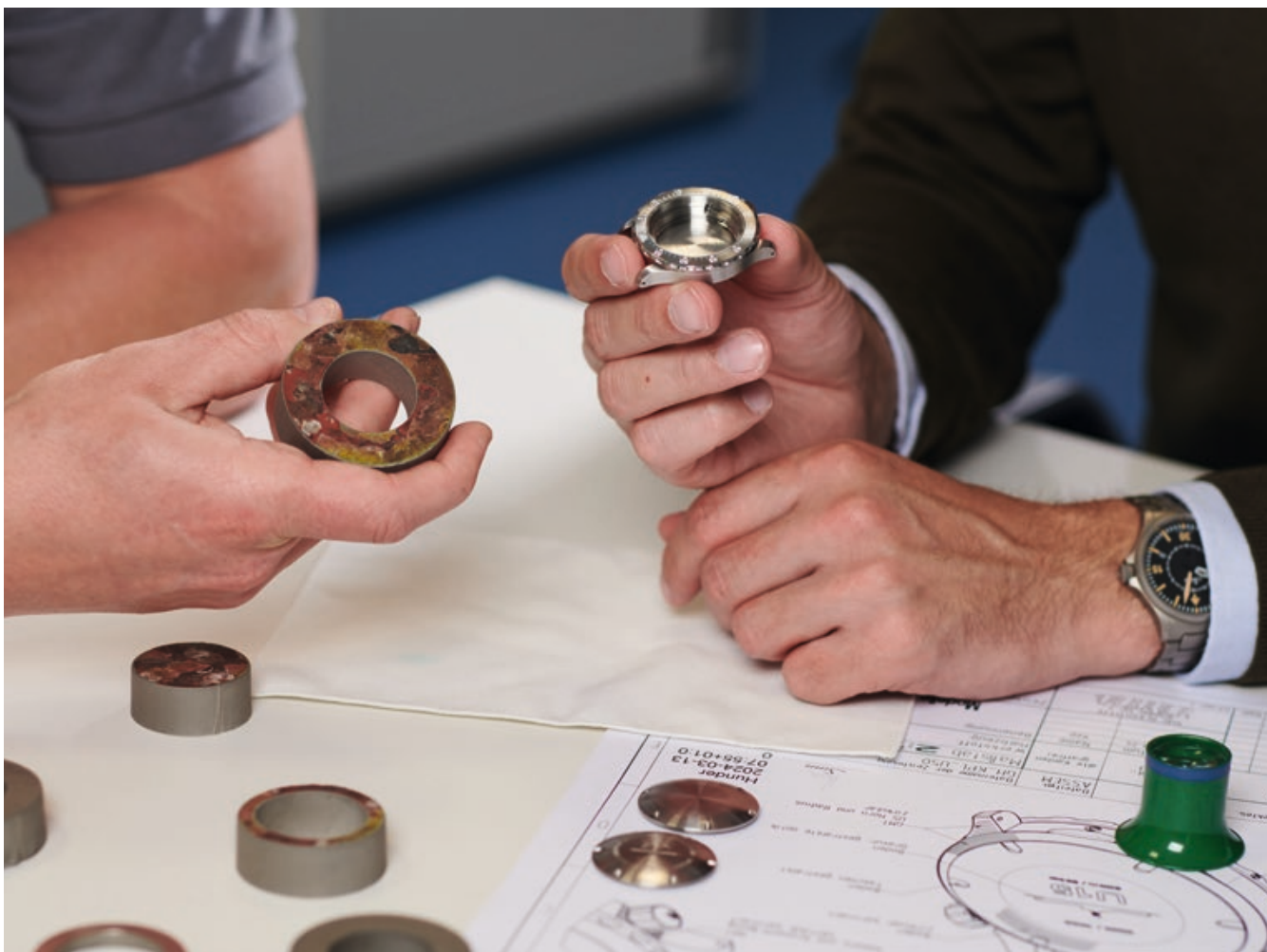
Vom geschichtsträchtigen Rohling zum fertigen Uhrengehäuse.

Es war die SUG, die den anspruchsvollen Auftrag übernahm, aus dem Original-U-Boot-Stahl der drei Unterseeboote die erforderlichen Komponenten zu fertigen – und dies aus gutem Grund. Denn die Sächsische Uhrentechnologie GmbH Glashütte ist ein bedeutender Akteur in der Welt des Baus von Uhrengehäusen und steht stellvertretend für das reiche Erbe und die handwerkliche Präzision, die mit dem Namen Glashütte verbunden ist. Seit ihrer Gründung liefert die SUG Gehäuse für unser Unternehmen. Die sächsische Firma hat sich aus kleinen Anfängen zu einem der führenden Hersteller entwickelt. Die SUG fertigt auf einem technologischen Niveau, das sich in Sachen Lösungskompetenz und Fertigungsqualität mit den Besten der Branche vergleichen lässt – und das europaweit! Dieser Erfolg ist Ausweis für das ausgezeichnete Wissen, das sich die SUG über die Jahre erworben hat und das immer wieder einzigartige Lösungen hervorbringt. Damit dies gelingt, bedarf es neben viel Erfahrung auch Kreativität und Leidenschaft – was reichlich vorhanden ist, denn die SUG konnte bisher selbst schwierigste Gehäusekonstruktionen zur Serienreife bringen. Auch beim Bau der Gehäuse für die U15, U16 und U18 konnte sie dies erfolgreich unter Beweis stellen.