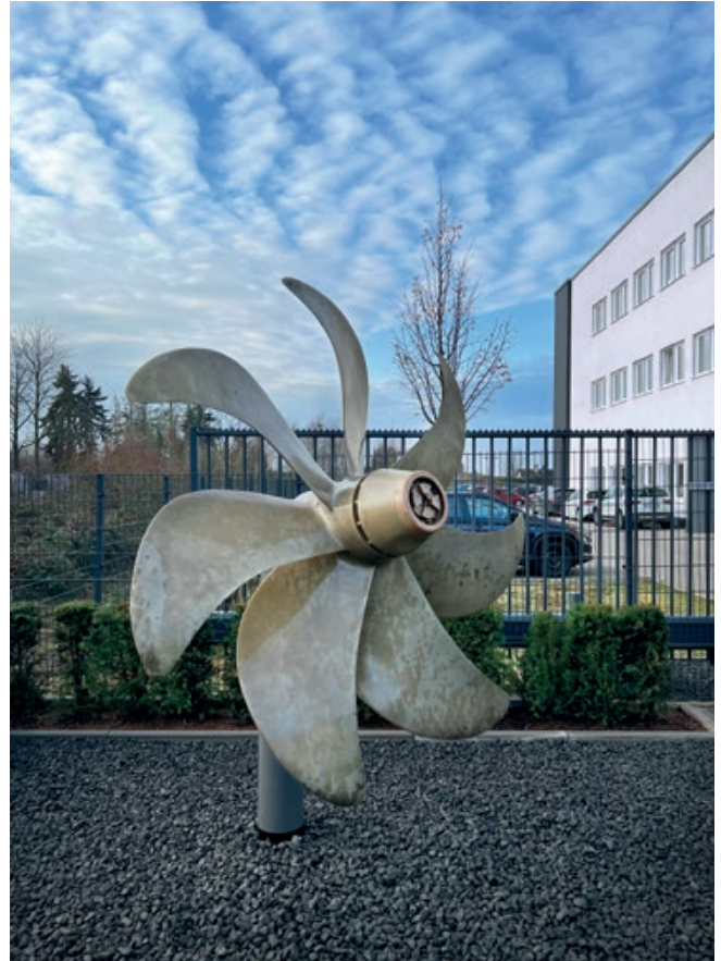
Der Original-Propeller des außer Dienst gestellten U-Bootes U 15, bestehend aus Schiffsbronze. Heute schmückt er unser Firmengelände am Hauptsitz.

Unsere neuen, jeweils auf 1.000 Stück limitierten Taucheruhren U15, U16 und U18 aus deutschem U-Boot-Stahl bilden damit den aktuellsten Bezug zur U-Boot-Klasse 206. Nach Außerdienststellung erwarben wir Material der Außenhüllen dieser Unterseeboote und fertigten aus ihnen die Gehäuse. Als Wertschätzung und Wiedererkennung verdeutlichen die Modellnamen die direkte Verbindung zwischen Uhr und gleichnamigen U-Boot.