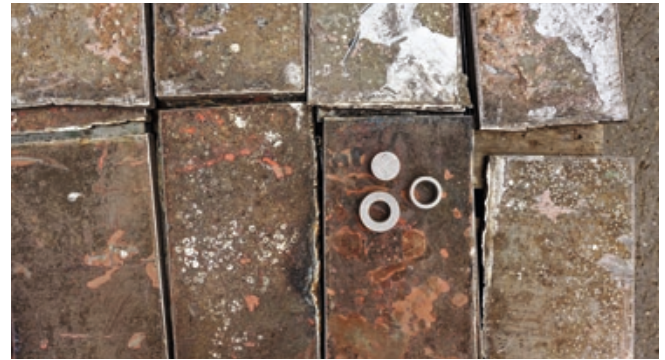
Gerichtete Stahlplatten aus dem Stahl des U-Bootes U 15 und die daraus entstandenen unterschiedlich dimensionierten Rohlinge.