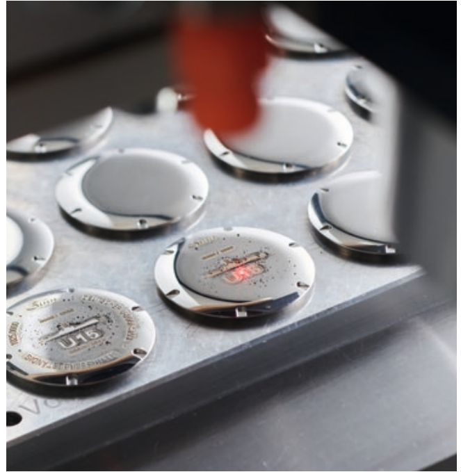
Die aufwendige Gravur des Schraubbodens, aufgebracht per Präzisionslaseranlage.