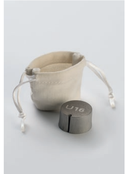
Gravierte Ronde, gefertigt aus dem Original-U-Boot-Stahl des U-Bootes U 16. Zu jedem Modell erhalten Sie die entsprechende Ronde in einem Leinensäckchen.