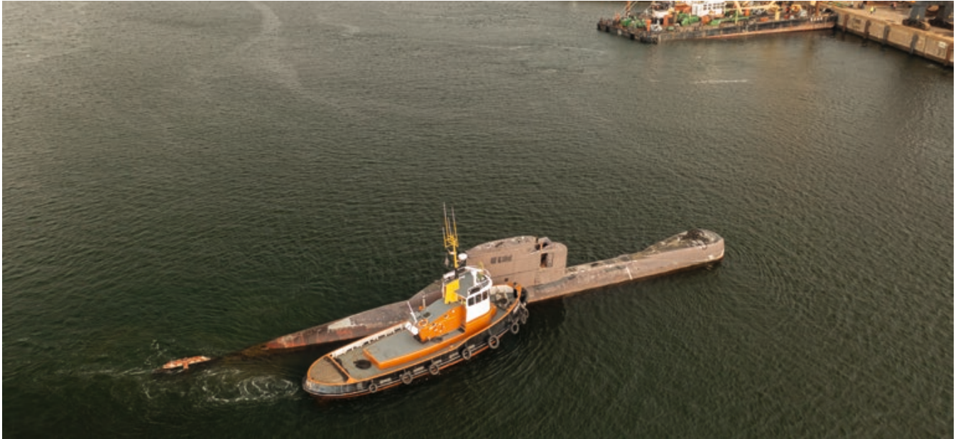
7:45 Uhr: Das Betriebsgelände der KSH ist per Schlepper fast erreicht.