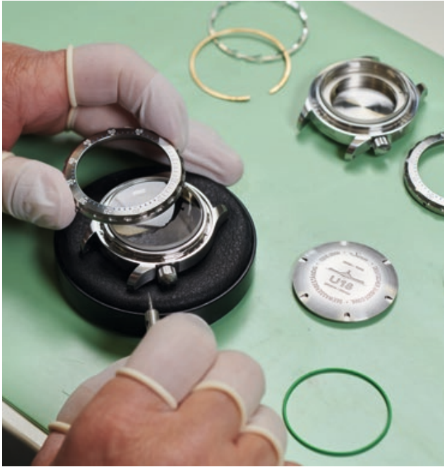
Ein Gehäuse wird aus seinen Einzelteilen, wie Drehring, Mittelteil, Boden, Saphirkristallglas, Krone, Dichtungen, Rast- und Federringen, komplettiert.