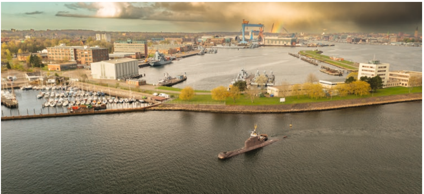
7:30 Uhr: Die letzte Reise des 1974 in Dienst gestellten U-Bootes U 15 beginnt. Nach 200.045 Seemeilen (entsprechend ca. 10 Erdumrundungen) wird das Boot per Schlepper vom Marinehafen Kiel zur Anlegestelle der KSH gebracht.

Die U-Boote der Klasse 206, entworfen in den 1960er Jahren und gebaut zwischen 1968 und 1975, waren ein Herzstück der Bundesmarine und später der Deutschen Marine. Mit ihrer kompakten Bauweise und ihrer Fähigkeit, effektiv zu operieren, boten sie die perfekte Antwort auf die Verteidigungsanforderungen Westdeutschlands in einer angespannten Zeit. Um den stetig wachsenden technischen Anforderungen gerecht zu werden, wurden einige dieser U-Boote im Laufe ihrer Dienstzeit auf den modernen Standard der Klasse 206 A aufgerüstet. Diese Anpassungen verlängerten nicht nur ihre Einsatzdauer, sondern hielten sie auch an der Spitze technologischer Entwicklungen. Die U-Boote der Klasse 206 sind ein beeindruckendes Zeugnis deutscher Ingenieurskunst. Ihr Einfluss auf den Fortschritt und Leistungsfähigkeit der modernen deutschen U-Boot-Flotte ist bis heute spürbar – ein Beweis für die außergewöhnliche Innovationskraft, die in ihre Konstruktion eingeflossen ist.