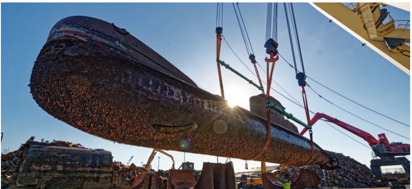
9:00 Uhr: Der Schwimmkran senkt das ca. 450 Tonnen schwere U-Boot U 15 in die sogenannte Wiege ab. Hier verbleibt das U-Boot bis zur Zerteilung des Rumpfes in einer stabilen Position.